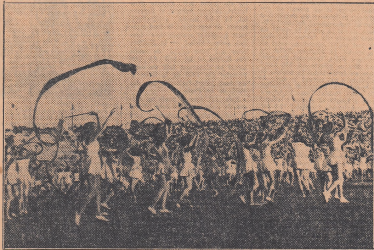
Repriza sportivelor din învățământul superior a smuls aplauze și aclamații entuziaste zecilor de mii de spectatori aflați în tribunele Stadionului „23 August” din Capitală. În fotografia noastră: moment din exercițiul de gimnastică cu panglici.

Peste tot, pe unde a trecut Ștafeta Internațională a Păcii, tineretul patriei noastre a ținut să-și