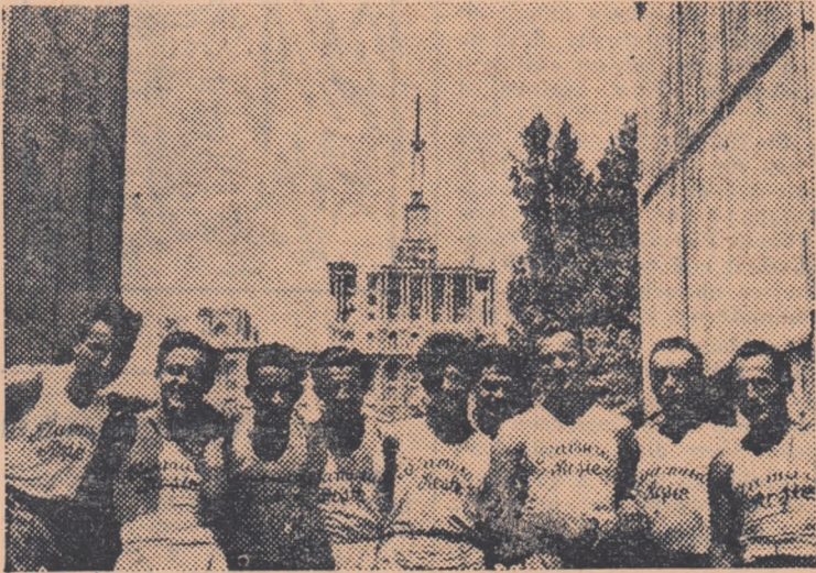
Cursele de marș se bucură de o largă popularitate în rîndul maselor de tineret din țara noastră. Iată un aspect din tradiționala ștafetă „Circuitul ziarului Munca”, desfășurată de curînd în Capitală, la care au participat numeroși concurenți. Mulți dintre aceștia vor lua startul mîine în „Circuitul gărilor”.

Asociația Locomotiva organizează mîine dimineață pe străzile Capitalei cea de a doua ediție a cursei de marș „Circuitul gărilor”. Parcursul măsoară 30 km. și este împărțit în trei schimburi de cîte 10 km. Echipelile participante vor avea cîte doi mărșălători pentru fiecare schimb.