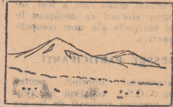
Fig. 3 bis

pentru compoziție nu trebuie să ducă la alegerea unor scheme rigide bazate numai pe simetrie. Uitați-vă, de exemplu, la fig. 4! Simetria compoziției e de vină că fotografia a ieșit atît de caraghioasă. Feriți-vă, în general, de așezarea în centrul fotografiei a elementelor principale, mai ales cînd așezarea aceasta centrală mărește și subliniază și de alte elemente, cum este cazul în fig. 4, cu așezarea centrală a muntelui din spate și simetria munților din față.