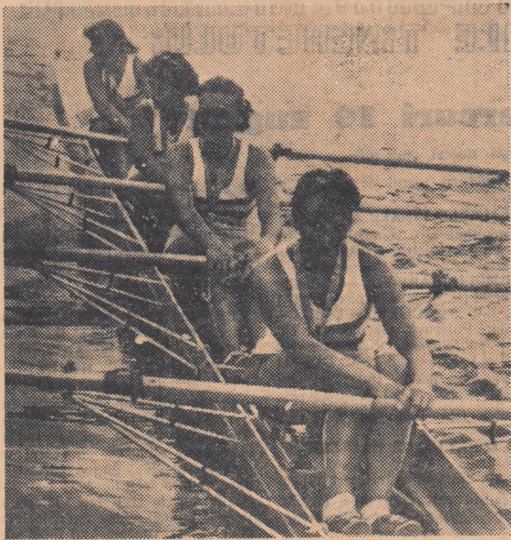
Componentele echipajului român de 4+1 visle, clasat pe locul II.

● De cele mai multe ori, publicul care asistă la o mare întrecere sportivă aplaudă din toată inima pe sportivul care a reușit o performanță. Așa s-a întâmplat și duminică după amiază la Snagov, când miile de spectatori au ovaționat îndelung echipajele de dublu, 4+1 rame, 4+1 visle și 8+1 ale țării noastre, care ne-au adus satisfacția unor comportări și rezultate superioare. Și, fără îndoială, canotoarele noastre au meritat din plin omagiul publicului! Dar nu trebuie să se uite nici o clipă că sportivul, în lupta pentru performanță, are alături de el un prieten, un slăbitor, un părtaș la îndelungată muncă de pregătire: antrenorul. Iată de ce, și noi, vom aminti numele celor care, părtași la greul muncii de pregătire, merită să fie