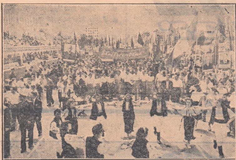
Ziua eliberării naționale, prilej de bucurie pentru oamenii muncii din patria noastră. Această frumoasă horă ce se desfășoară în fața tribunelor, redă un crîmpei al acestei uriașe bucurii.

Lucrătorii combinatului raportează partidului îndeplinirea cu 6 luni înainte de termen a planului cincinal. În perioada acestor cincini ani, uriașa rotativă sosită din Uniunea Sovietică a tipărit 4.800.000.000 de ziare. Tot în acest timp au fost editate