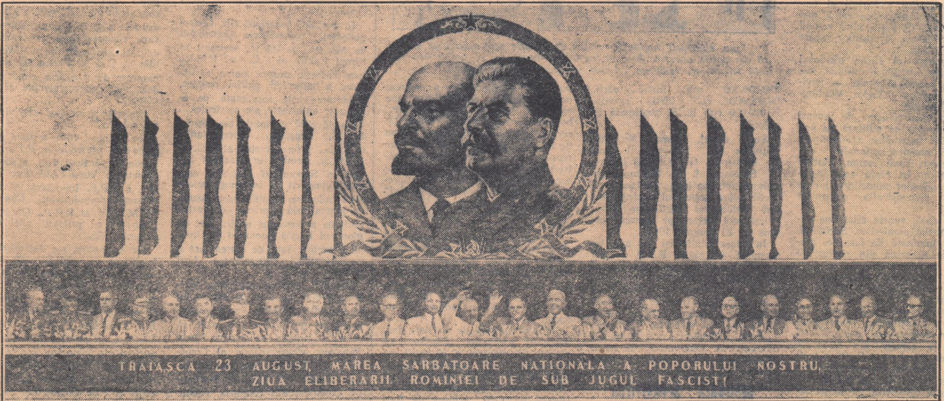
TRAIASCA 23 AUGUST, MAREA SARBATOARE NATIONALA A POPORULUI NOSTRU, ZIUA ELIBERARII ROMINIEI DE SUB JUGUL FASCISTI

Un aspect al tribunei centrale din Piața „I. V. Stalin” în timpul demonstrației oamenilor muncii din Capitală