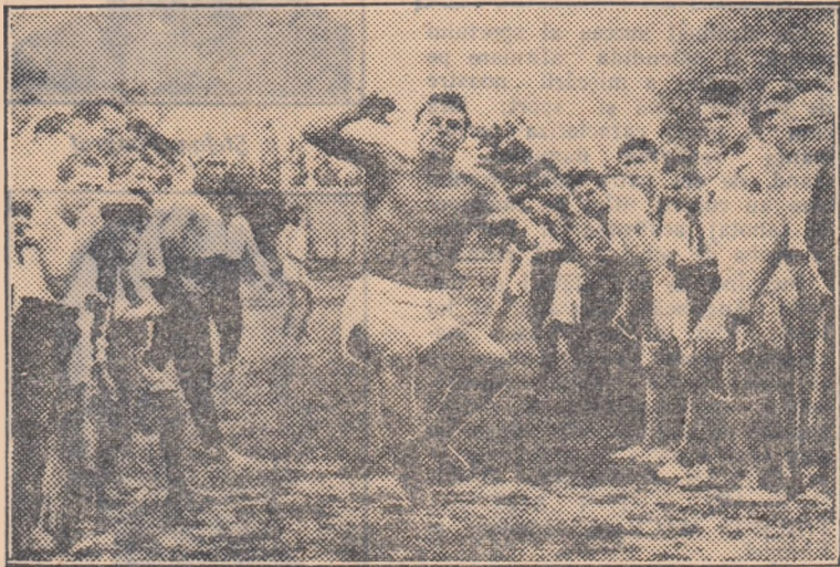
Probele de atletism din cadrul Spartachiadei sindicale atrag nu numai un mare număr de concurenți dar și de... spectatori