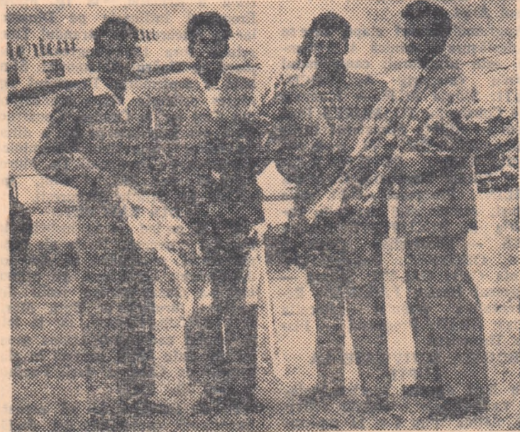
Cei patru vislasi ai bărcii de schif 4 fără cirmaci, campioni ai Europei, fotografiați la sosirea pe aeroportul Băneasa. Ei poartă coroana oferită de F.I.S.A. echipajelor campioane.

„După ce vinert, în recadificări, am întrecut echipa Austriei de o manieră categorică, în cercurile spectaculoase de la Gand se spunea că seria a II-a a semifinalei de simbioză este de fapt o veritabilă finală. Lucrul acesta nu era de mirare, din moment ce aici se întrecuau: Danemarca (campionă în 1953), Italia