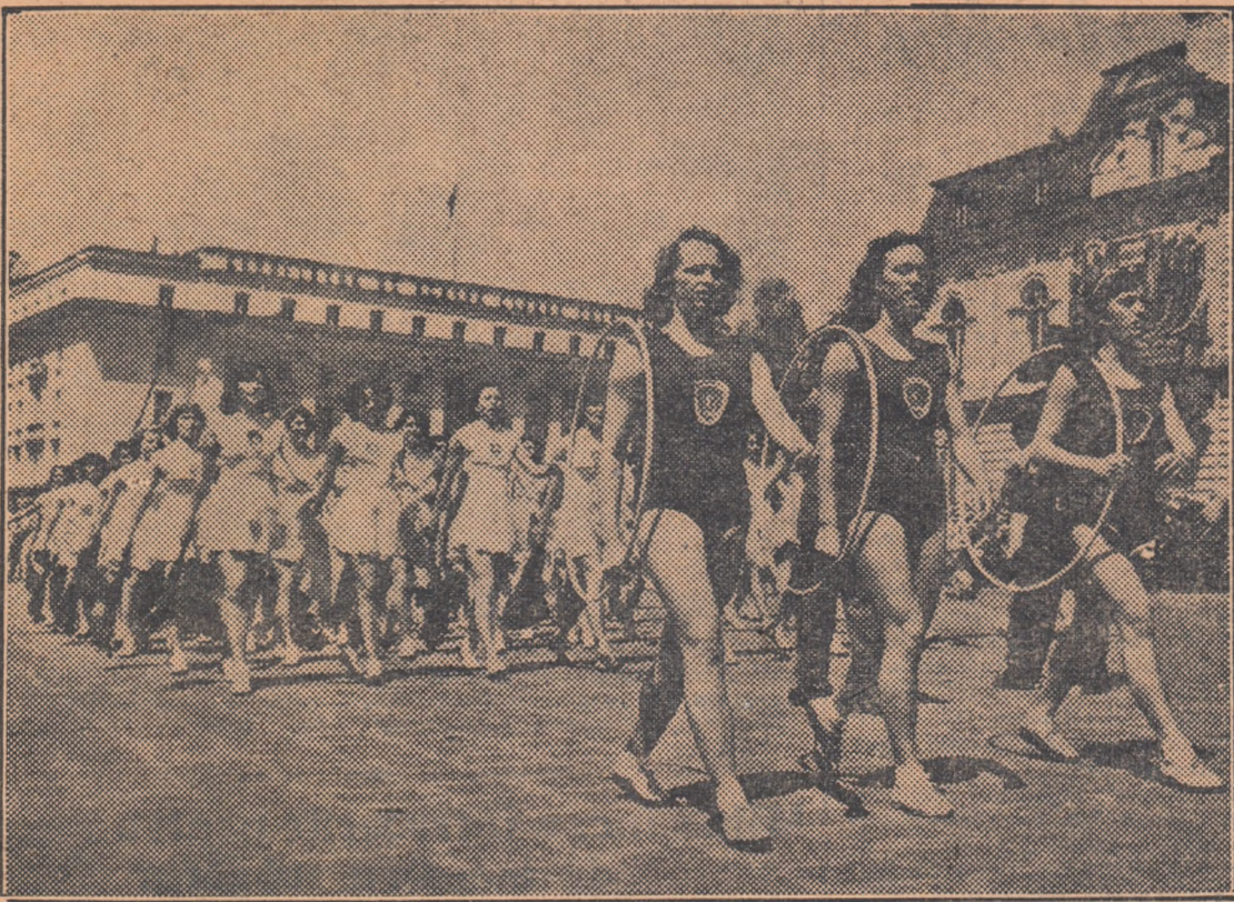
Studentele Institutului de Cultură Fizică din Sofia defilează în cadrul paradei, care a avut loc anul trecut cu prilejul sărbătorii naționale a poporului bulgar.