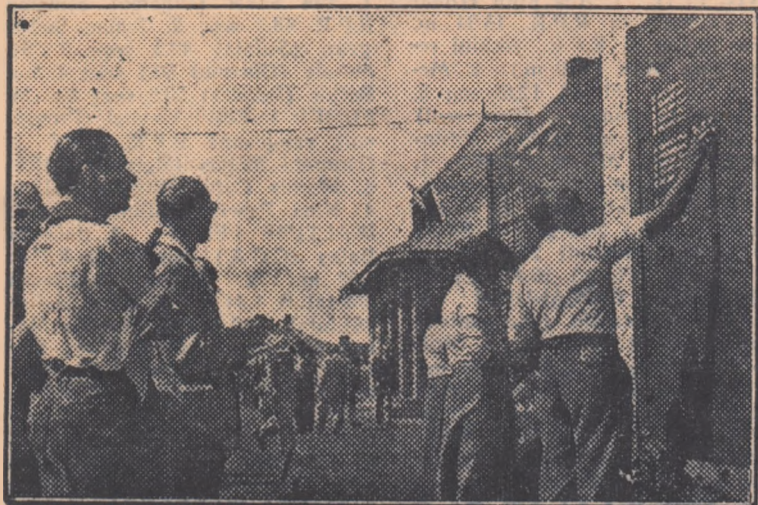
Primele rezultate sînt afișate pe tabelul special amenajat și spectatorii le urmăresc cu atenție.