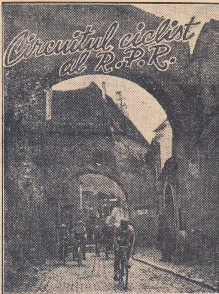
De-a lungul celor 2000 km. ciclismul vor trece și prin astfel de locuri pitorești. În clișeu: aspect din Circuitul din 1953 (Sibiu).