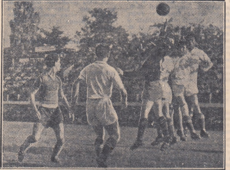
Fază din meciul Dinamo VI Buc.—Locomotiva Craiova (5—0). Patru apărători craioveni au sărit la minge împreună cu portarul lor, la unul din numeroasele atacuri ale echipei Dinamo VI Buc.

— În campionatul de calificare, vor avea loc meciurile: Știința Iași—Flamura roșie Steagul roșu București, Flamura roșie U.T. Timișoara—Flamura roșie Rm. Vilcea și Voința Baia Mare—Știința Bistrița (feminin) și Constructorul Brăila—Metalul II Reșița, Constructorul Sibiu—Recolta Bulgăraș, Aiud—Aninoasa (masculin).