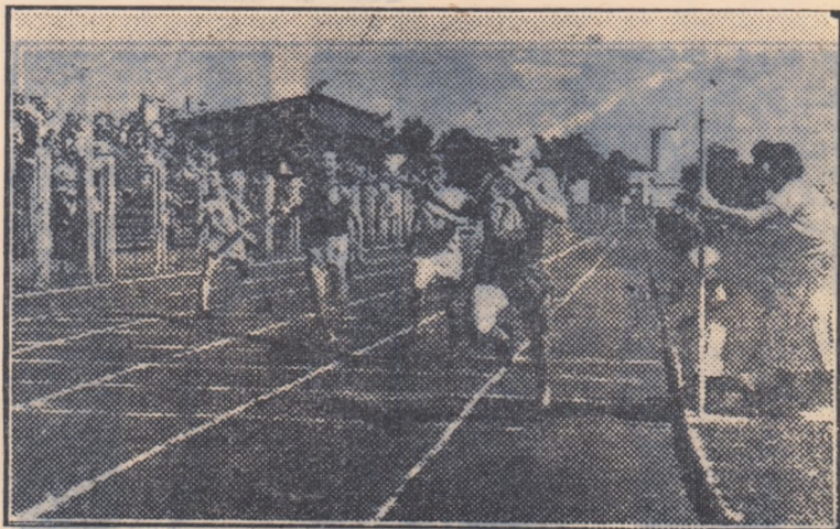
Întrecerile de atletism, s-au bucurat, în fiecare regiune, de un frumos succes.