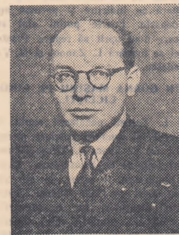
D. Bronstein (U.R.S.S.)

șahiști foarte tineri. Argentina-lul Panno și sovieticul Spasski, fostul și actualul campion al lumii printre juniori, au reprezentat strălucit la acest turneu generația tină. Ambii au prestat un joc excelent, bogat în combinații scilpitoare dar și în idel