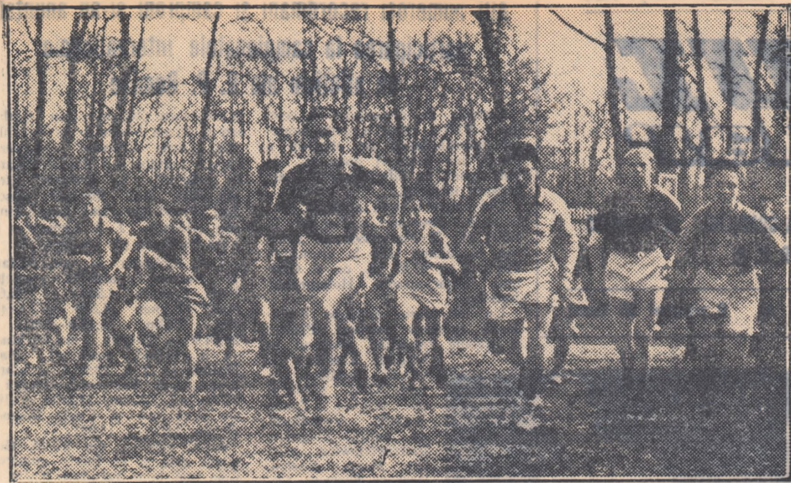
Crosul a atras întotdeauna mase largi de tineret. Și în acest an vor trebui depuse toate eforturile pentru asigurarea unui succes deplin acestei tradiționale competiții.