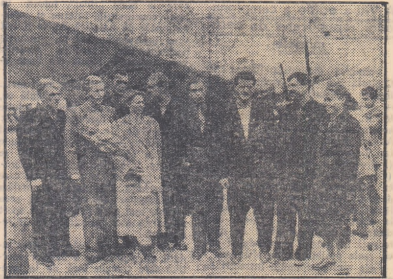
Lotul atleților sovietici care au participat la întrecerile din R. P. F. Jugoslavia la sosirea pe aeroportul Băneasa.

COMITETUL INTERNATIONAL DE ATLETISM ALS A.P.E.