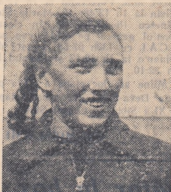
Galina Zibina, recordmana mondială la proba de aruncare a greutății, ia parte la întrecerile de la București.

De altfel, această părere este împărtășită și de ceilalți concurenți la cea de a VIII-a ediție a campionatelor internaționale soșii încă de ieri la București. Chiar și Nina Otkalenko, care s-a arătat nemulțumită de titlul apărut în ziarul „Sportul popular” deoarece i se pare că la 2 minute