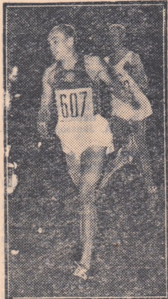
Cel mai bun alergător european pe 400 m. plat, sovieticul Ardalion Ignatiev, a terminat învingător și în întrecerile de ieri de pe stadionul Republicii.

De la plecare, Barkanyi intră primul pe turantă. Dar chiar pe turantă, Ivakin ia conducerea, pe care o va păstra pînă aproape de sfîrșit. La 200 m. el trece în 25,9 sec. iar la 400 m. în 53,9 sec. După primul tur, în urma sa se găsesc: Markusson, Maricev, Reimigel, Barkanyi și Jungvirth, care pînă atunci stătuse undeva pe la coada plutonului. La 600 m. tot Ivakin este cel care conduce (timp 1:22,6), dar fiecare dintre ceilalți