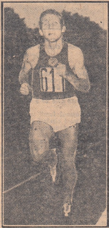
Deși timpul a fost nefavorabil, Vladimir Kuț a realizat ieri performanța de 28:59,2, un nou record al Uniunii Sovietice, la numai 5 secunde de recordul mondial al lui Zatopka.

zistă pe rind tuturor atacurilor întreprinse de adversarii săi. Primii 400 m. sînt parcurși în 59,1 sec., iar la 800 m. plutonul trece în timpul de 2:00,8. Cei care l-au talonat pe Hermann au fost pe rind, maghiarul Bereș, care însă nu s-a putut menține pe prima poziție a probei pînă la ultimul tur, apoi Richtzenhain, care a renunțat însă curînd la lupta directă cu Hermann, preferînd să stea la „adăpost” (dacă la viteză cu care s-a alergat mai poate fi vorba de așa ceva) și Okorokov care, în special, în ultimul tur a făcut tot ceea ce i-a stat în putință pentru a trece de Hermann. Poate că atletul sovietic, dacă