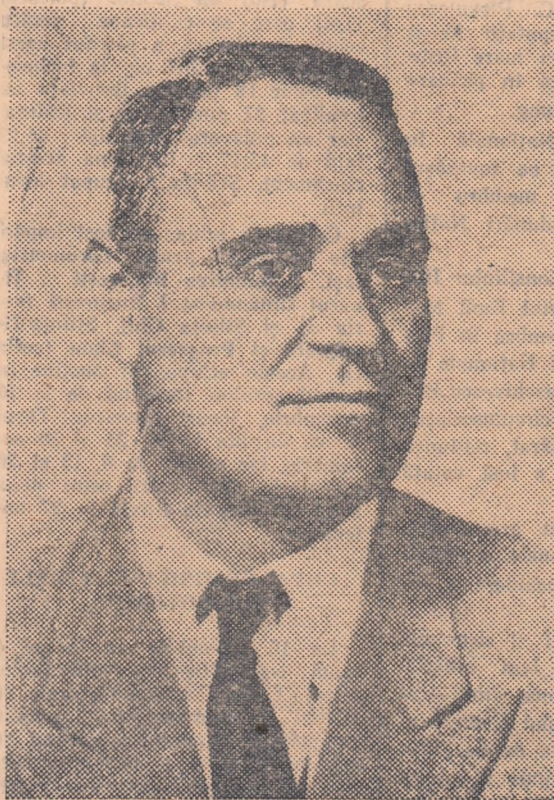
Tovarășul GH. GHEORGHIU-DEJ Prim secretar al Comitetului Central al P.M.R., Președintele Consiliului de Miniștri al R.P.R.

vrednic pentru interesele clasei muncitoare și poporului. De aceea guvernele burghezo-moșierești l-au ținut aproape 12 ani în închisoare. După eliberarea țării, tovarășul Chivu Stoica a fost însărcinat de Comitetul Central al Partidului cu diferite munci de răspundere în conducerea mișcării sindicale, în funcția de ministru al Căilor Ferate și cea de ministru al Metalurgiei, apoi în funcția de prim-vicepreședinte al Consiliului de Miniștri, coordonînd activitatea unei grupe de ministere industriale. Tovarășul Chivu Stoica s-a dovedit un tovarăș cu experiență, un harnic și