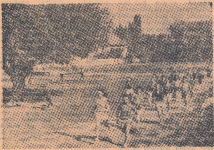
Aspect din crosul regiunii București, de anul trecut. Etapa pe Capitală și pe regiunea București a actualei ediții a crosului „Să întimpinăm 7 Noiembrie” se va desfășura miine dimineață, începând de la ora 9, pe hipodromul Băneasa-trap.

După cinci săptămâni de desfășurare, crosul de mase „Să întimpinăm 7 Noiembrie” a ajuns în penultima etapă, etapa regională. Miine, în toate capitalele de regiune sute de tineri calificați în etapa a doua, pe raion, vor veni să-și încerce forțele în întrecerea în care echipa cișligătoare va avea cinstea de a-și reprezenta regiunea în etapa finală, la București. Și, în timp ce în toate orașele reședință de regiune se vor întrece participanții la etapa regională, în Capitală va avea loc, în organizarea Consiliului orașenesc, etapa pe oraș.