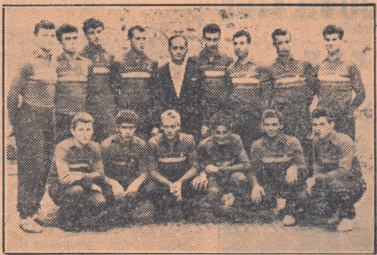
Echipele Dinamo 6 București, campioană republicană de oină pe anul 1955.

În jocul decisiv aceste două echipe au avut o bună comportare, Dinamoviștii, care au început jocul la bătaie, au reușit să-și crezeze, datorită siguranței în lovituri,