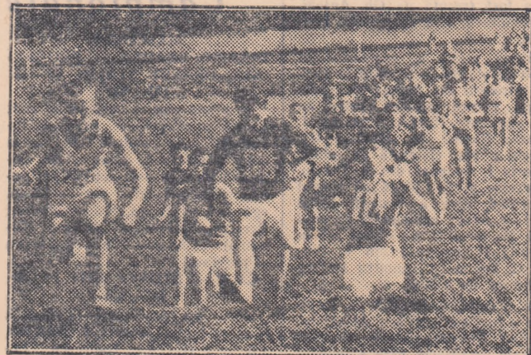
Aspect de la întrecerile de cros desfășurate ieri în Capitală, în cadrul crosului de masă „Să întîmpinăm 7 Noiembrie”.