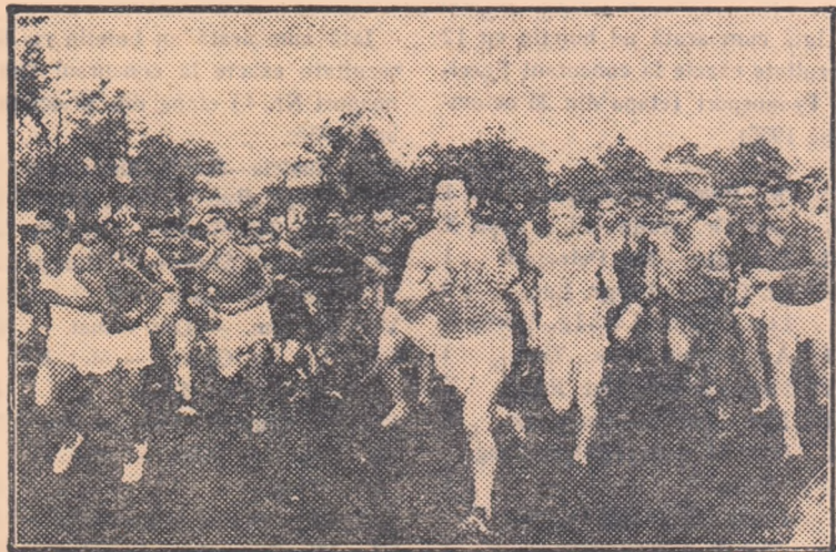
Cei peste 100 de participanți în cursa seniorilor au mers în grup compact, o mare parte din distanță