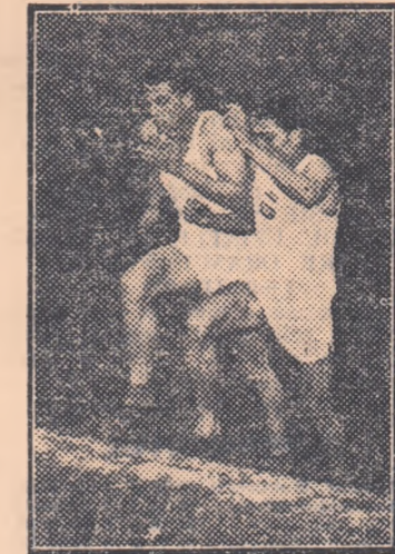
Alergarea s-a făcut pe teren variat. Iată-i pe concurenți trecînd unul dintre obstacolele de pe traseu.