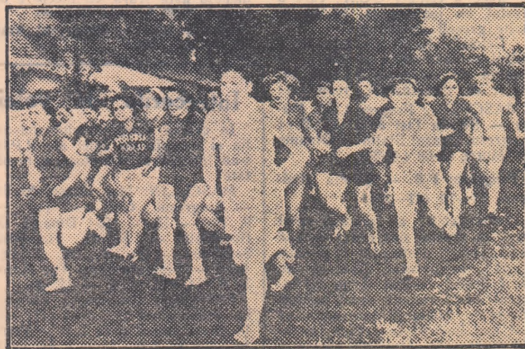
Cursa senioarelor a prilejuit o trecere dîră între echipele reprezentative ale raionilor țării