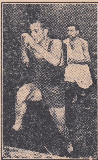
Un participant la cros în plin efort...

Cu prilejul „Lunii Prieteniei Romîno-Sovietice”, în orașul Cimpulung-Muscel au fost organizate nu-