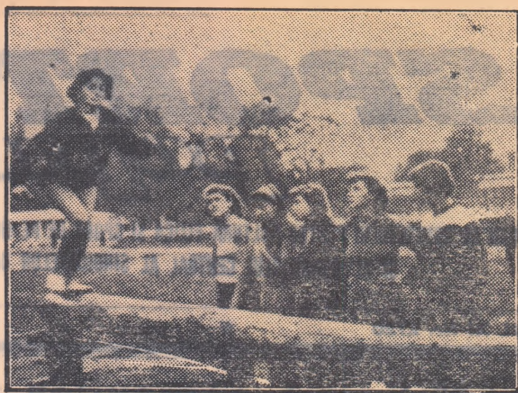
„Vedeți? Nu-i de loc greu!“ pare să spună tînăra aspirantă tovarășelor ei care încă nu s-au încumetat să parcurgă birna.