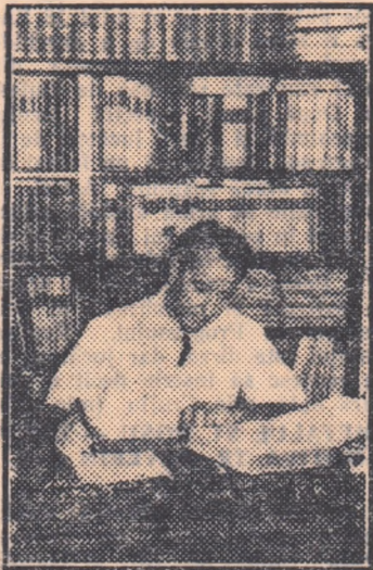
Fiecare succes, un rezultat al îndelungatei ore de studiu.