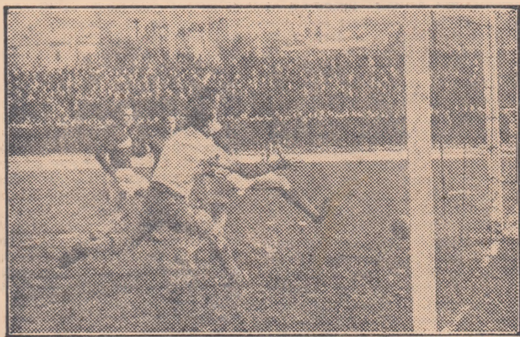
2—0! Caricaș (C.C.A.) trage plasat în poarta goală, făcînd inutilă intervenția lui Stăncescu și a portarului Nebela. (Fază din jocul C. C. A. — Locomotiva Constanța 4—0).

● Două echipe gălățene s-au întrecut duminică în meci amical: Locomotiva și Știința. Rezultatul: 2—1 pentru Locomotiva.