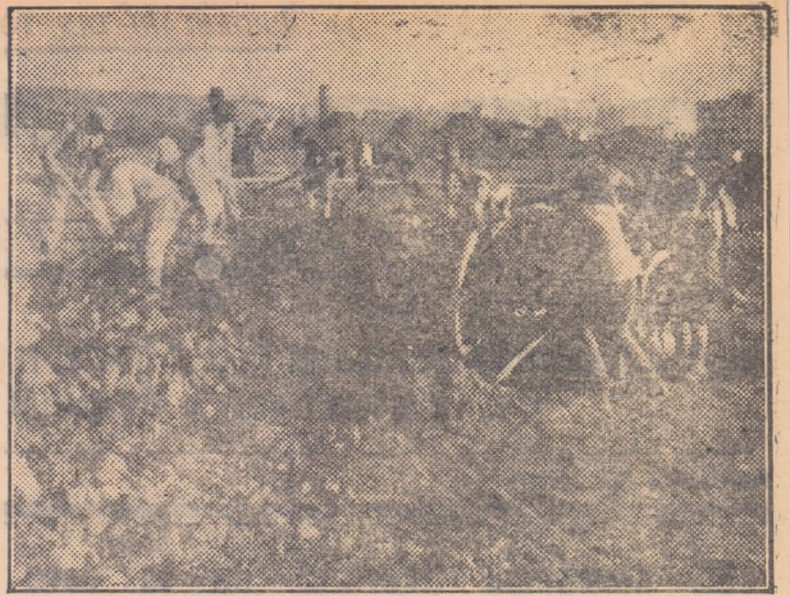
Colectivul sportiv Progresul din Beiuș a hotărît să construiască pe un teren viran o importantă bază sportivă. În fotografie, un grup de tineri au început primele lucrări de amenajare. De atunci, au mai trecut însă multe zile...