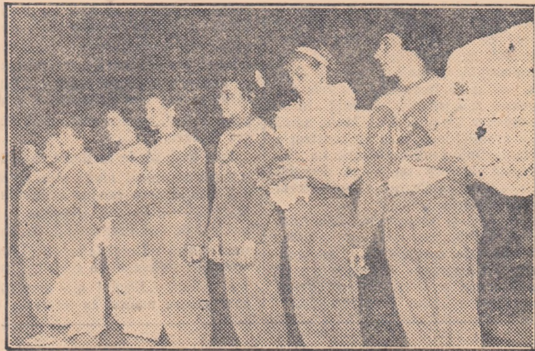
Echipa feminină de gimnastică a R. P. Romine, care a întrecut reprezentativa R. P. Ungare.