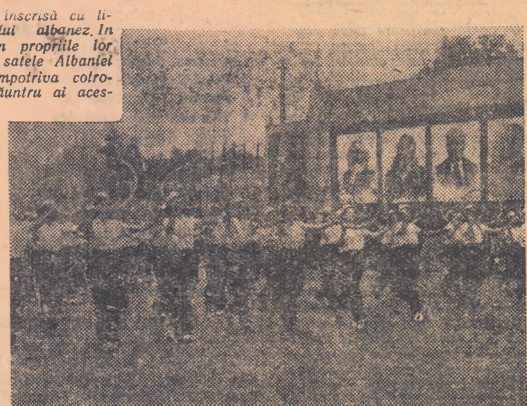
Pline de voce bună, aceste tinere sportive albaneze defilează în pas sprinten pe străzile Tiranei, cu prilejul unei mari demonstrații. În anii regimului de democrație populară, în Republica Populară Albania au fost atrase în practicarea sportului mii și mii de tinere

● La Johannesburg, în cadrul unei reuniuni la care au participat și atleții din R.F. Germană, aflați în turneu în Africa de Sud, atlețul sud-african Price a obținut, cu rezultatul de 7,70 m., un nou record al Imperiului Britanic la săritura în lungime. Pe locul doi s-a clasat atletul german Oberbeck cu 7,50 m.