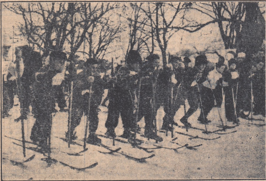
Concursurile de schi atrag mase largi de tineret de toate vârstele. Anul acesta, înreg în regimul patrii are posibilitatea să participe la concursurile de schi ale Spartachiadei de iarnă a tineretului.