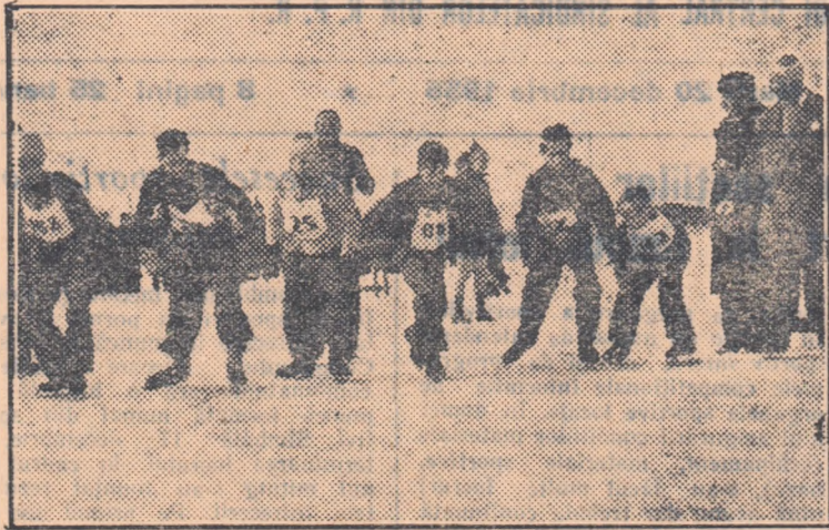
Pe lângă schi, șah, tenis de masă etc., participanții la Spartachiada de Iarnă a Tineretului vor avea prilejul să se întrecă și în probele de patinaj. În fotografie: un aspect de la trecutele concursuri populare de patinaj

latează un amănunt deosebit de interesant în această privință: pe lângă disciplinele sportive prevăzute de regulamentul Spartachiadei, tineretul din satele și orașele raionului Bicăz participă și la competiții de box, întrucât sportul cu mânuși se bucură de o largă popularitate în rândurile sportivilor din acest raion.