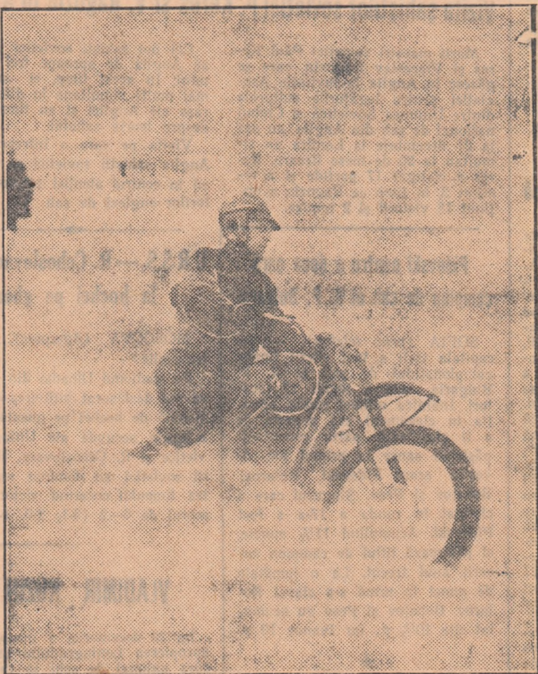
Aspect din desfășurarea tradiționalului motocros dotat cu cupa „Voroșilov”

În acest timp, schiorii, patinatoarii, hocheiștii, participă la numeroase competiții organizate în toate orașele și satele ținutului. Echipa locală a Casei Olișterilor joacă în clasa „A” a campionatului unional de hochei cu mingea.