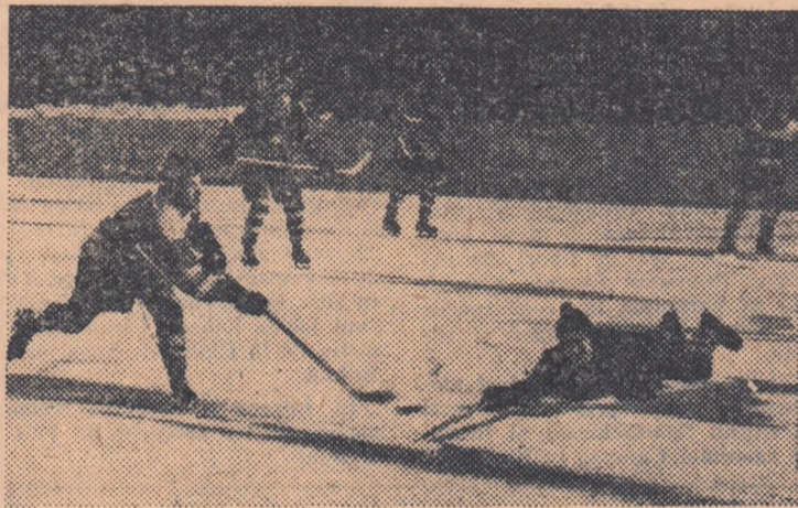
În cadrul pregătirilor pentru Jocurile Olimpice de iarnă hocheiștii reprezentativei U.R.S.S. susțin numeroase întîlniri internaționale. Recent, hocheiștii sovietici au jucat trei meciuri în Elveția, încheindu-le cu tot atîtea victorii. Fotografia noastră a fost luată pe stadionul din Moscova la sfîrșitul lunii trecute, cu prilejul meciului de hochei U.R.S.S. — R. Cehoslovacă (6—2).