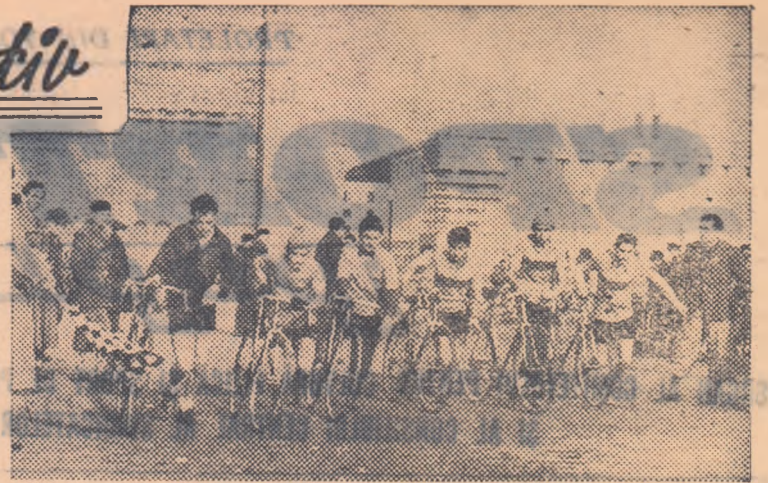
Va mai trece cîtiva vreme pînă cînd vor începe întrecerile sportive în aer liber. Dar succesul lor cere o muncă de pregătire care trebuie să înceapă chiar de pe acum...