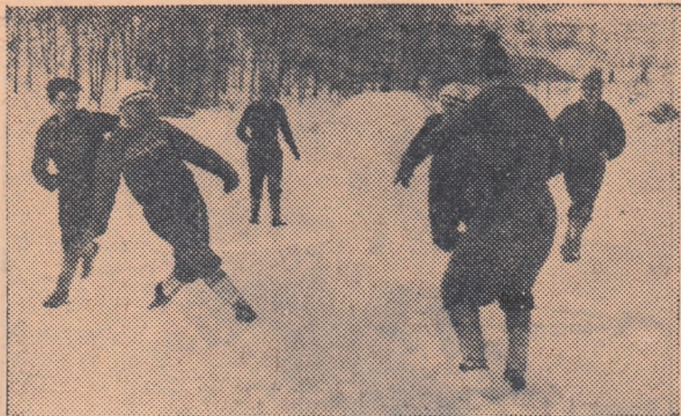
Iata un aspect de la meciul de antrenament de duminica de la Parcul Dinamo. Pe dinamovisti ti puteai recunoaste dupa caciulitele albe

Jocurile continua mine dimineata, cind vor avea loc semifinalele de simplu barbați si finala de simplu femei.