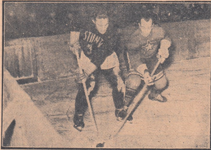
Czaka II (Știința Cluj) și Lörincz (C.C.A.) în luptă pentru puc

Metalul Orașul Stalin — Avântul Miercurea Ciuc 8-5 (3-2, 3-2, 2-1). Cea mai mare surpriză a competiției și a sezonului hocheistic! Și acest 8-5 pentru Metalul nu este surprinzător atât ca rezultat cât mai ales prin faptul că reprezintă just raportul de forțe pe pe teren. Se cunosc numeroase ca-