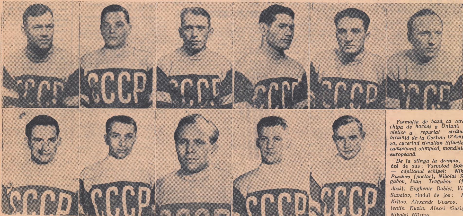
Formația de bază cu care echipa de hochei a Uniunii Sovietice a reperiat strălucita biruință de la Cortina D'Ampezzo, cucerind simultan titlurile de campioană olimpică, mondială și europeană.

Sărituri de la trambulină: 1. Hyvarinen (Finlanda) 81,0 m. — 84,0 m.; 57,5 și 60,0 — note pentru lungimea săriturii; 54,0 și 55,5 — note pentru stilul săriturii. Total — 227 pct.; 2. Kalokorpi (Finlanda) 83,5 m., 80,5 m.; 50,0 — 56,5; 54,5 — 54,0; 225,0 p.; Glass (Germania) 83,5 m., 80,5 m., 60,0 — 56,5; 55,0 — 53,0; 224,5 p.; 3. Bolkart (Germania) 80,0 m., 81,5 m.; 56,5 — 57,5; 53,0 — 53,5; 222,5; 4. Pettersson (Suedia) 220 p.; 5. Daeschcher (Elveția) 219,5 p.; 6. Kirjonen (Finlanda) 219,0 p.; 7. N. Munteanu (România) 68,0 m., 70,0 m., 43,5 — 46,0; 43,5 — 44,0; 175,0 p.; 51 săritori clasificați.