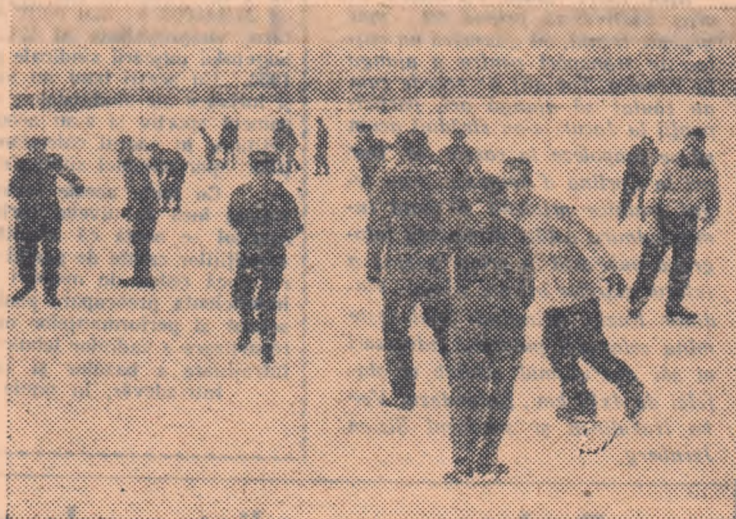
Pe patinoarul de pe stadionul „Flamura roșie” C.A.M., zeci și zeci de tineri și tinere din Capitală, se întrec la patinaj