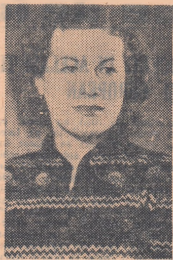
Stockholm 6 (Agerpres).

În orașul suedez Borlänge s-au desfășurat în zilele de 4 și 5 februarie campionatele mondiale feminine de patinaj viteză. La ediția din anul acesta a campionatelor au participat cele mai bune patinatoare de viteză din Uniunea Sovietică, Suedia, Finlanda, R. Cehoslovacă, R. P. Ungară, R. D. Germană și Coreea.