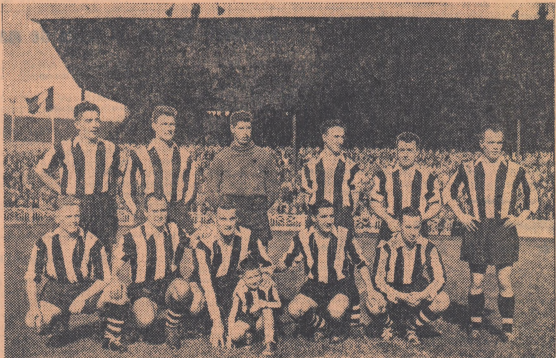
Jucătorii echipei S.C. Charleroi fotografiați înaintea jocului cu echipa iugoslavă „Steaua Roșie”, pe care i-au susținut anul acesta