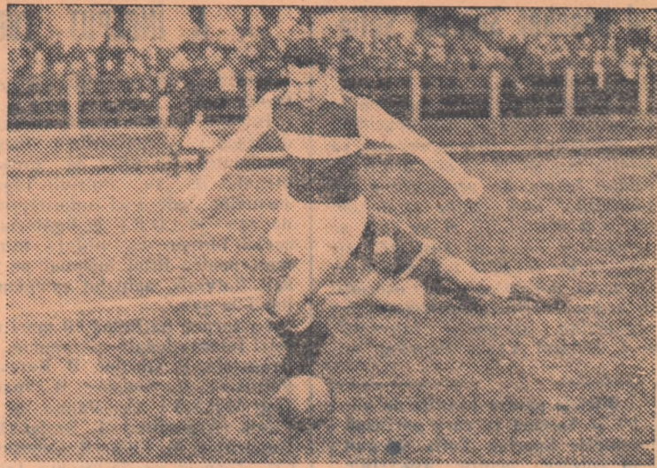
Girleanu a trecut de dr. Luca — aflat acum la pămînt — și se îndreaptă spre poarta lui Catina. Fază din meciul Știința Cluj — Știința Timișoara disputat duminică la Cluj.

Pentru luna aprilie I. S. Pronosport acordă în continuare premii speciale săptămînale buletinelor cu „0” rezultate.