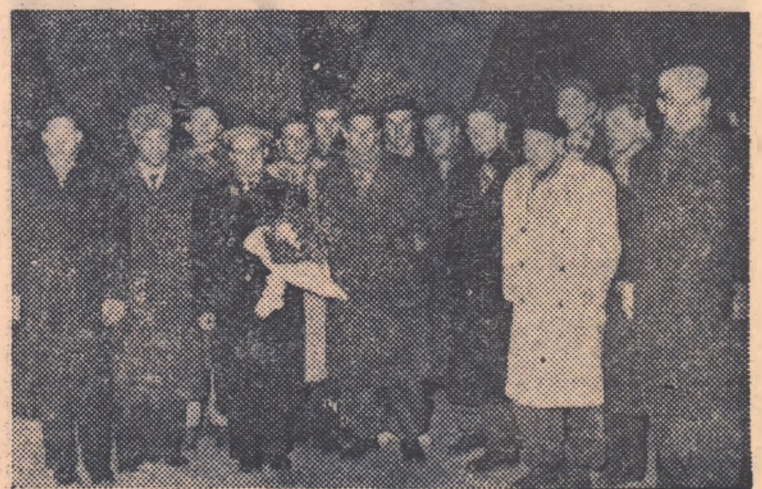
Jucătorii de volei și baschet ai echipelor Spartak Sofia fotografiați în momentul sosirii la Giurgiu.