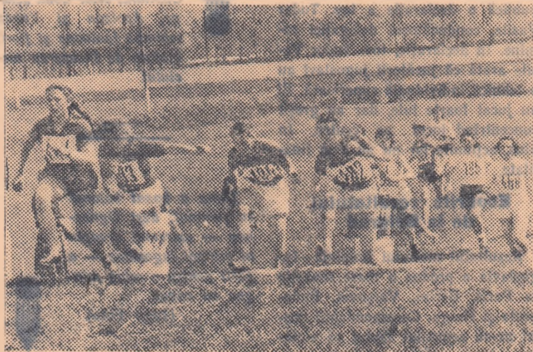
Da! Aici nu-i chiar așa ușor. Obs tacolul este destul de dișicil. Dar, crosul este o alergare pe teren variat!

Nici la editia din acest an a finalelor crosului de masă n-au lipsit abandonurile sau... subcările pe parcurs. Astfel de lucruri distonează cu aspectul sărbătoresc al unei finale și este de dorit ca pe viitor colectivele din cadrul cărora sînt recrutați finaliștii să acorde pregătirii acestora mai multă atenție.