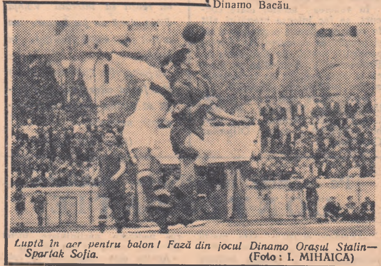
Luptă în aer pentru balon! Fază din jocul Dinamo Orașul Stalin — Spartak Sofia.

În deschidere, la ora 15, meciul amical Dinamo București-Dinamo Bacău.