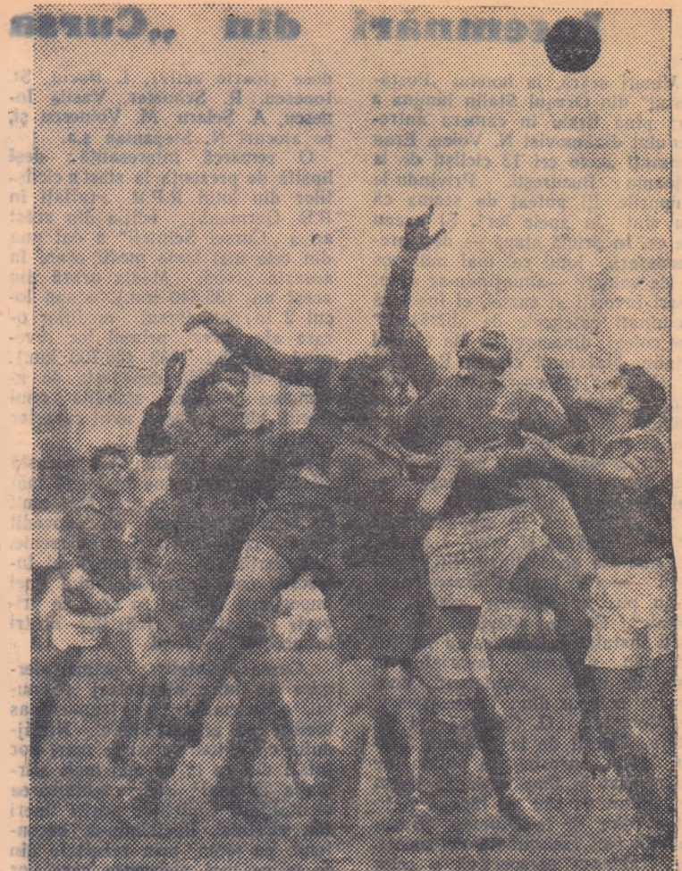
Luptă pentru balon la o țușe, între înaintașii feroviarilor și cei de la C. C. A. (C. C. A.-Locomotiva 29-6)