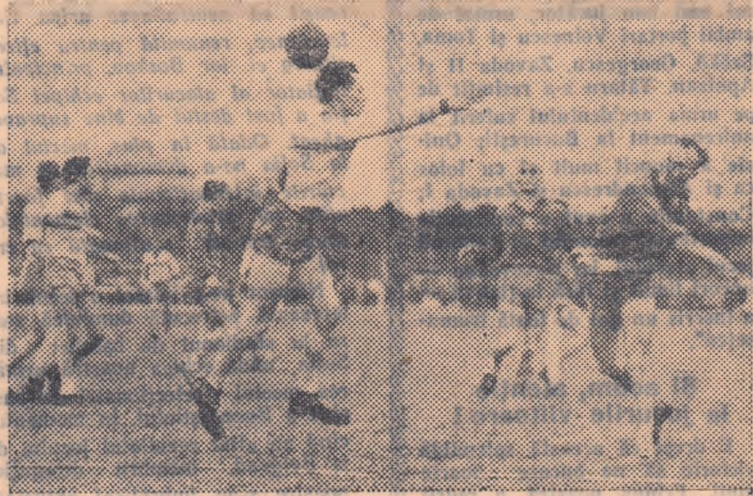
Duminică pe stadionul Tineretului, handbaliștii de la C.C.A. au reușit să întrecă Voința Sibiu, după un joc în care au arătat mai multă finalitate în acțiuni.

„Startul” slab al unora dintre echipele participante la campionatul masculin de handbal categoria A a făcut ca în primele trei etape clasamentul să nu reprezinte o scară reală a valorii formațiilor. Cu fiecare nouă etapă însă, el începe să oglindească tot mai just realitatea. Acest lucru s-a putut remarca în etapa a IV-a cînd au intervenit primele clarificări, și s-a accentuat în etapa a V-a, din care au lipsit rezultatele-surpriză, în schimb, ierarhia echipelor în clasament s-a apropiat mai mult de treptele pe care ar trebui să le ocupe, normal, participantele la campionat. De altfel, o reproducere a clasamentului cu menționarea locului ocupat de fiecare echipă în etapa trecută este mai elocventă decît orice comentariu: