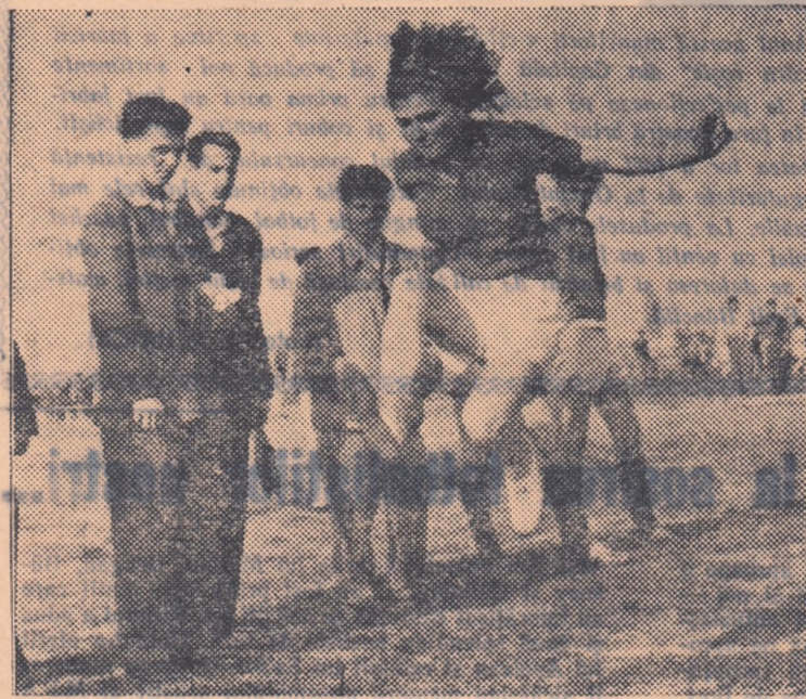
Un aspect din timpul concursurilor de pe stadionul uzinelor T. Vladimirescu

Din aceste exemple trebuie să învețe toți activiștii sportivi. Să nu uităm că Spartachiada de vară a tinereții este cea mai mare competiție de mase din acest an și că primul său fel este de a mobiliza la startul întrecerilor masele de tineri și tinere din întreprinderi. Iată de ce este necesar ca pe viitor accentul să fie pus în special pe mobilizarea concurenților, pentru că succesul unei astfel de competiții se hotărăște tocmai în prima etapă.