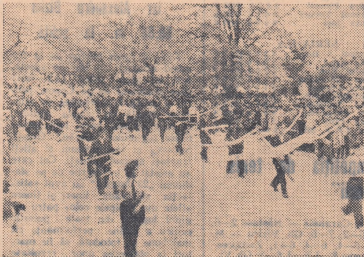
Un aspect de la defilarea oamenilor muncii din Galați: în coloana sportivilor, într-o aliniere perfectă, trec mîndrii constructorii de automobile

Constructorii siderurgisti raportează la rîndul lor cu mîndrie că au terminat lucrările principale de construcții la furnalul de 700 m.c. și au executat un volum însemnat de lucrări la construcția noii oțelării Martin, la oțelăria electrică, la cele două baterii de cocs și semicocs de la Hunedoara și Calan.