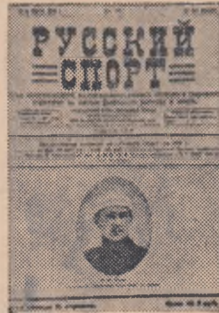
Unul din numerele revistei „Ruskii Sport”, care a apărut între anii 1919—1923 la Moscova.

al activiștilor de cultură fizică din întreaga Rusie, convocat la 3 aprilie 1919 la Moscova, din inițiativa Vsevoșucului (Direcția instruirii militare generale),