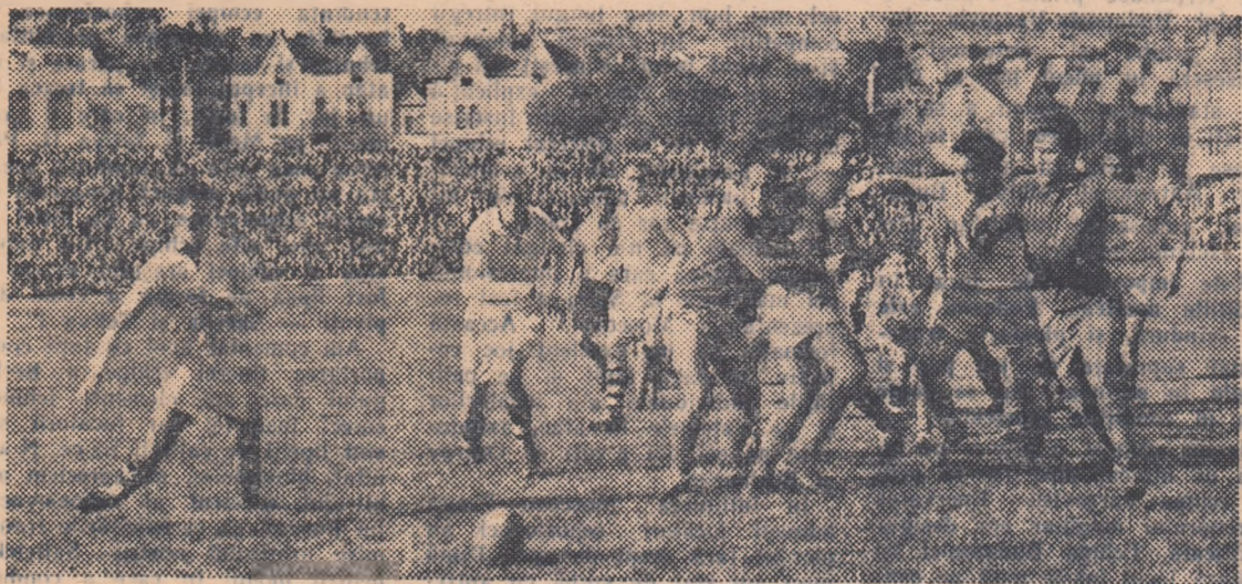
O fază dintr-un meci susținut în toamna trecută în Anglia de către echipa selecționată a Bucureștiului.

Vivian Jenkins, al cărui articol îl publicăm în continuare, a fost de 14 ori internațional în echipa Țării Galilor și este socotit actualmente cel mai competent comentator de rugby al Marii Britanii.