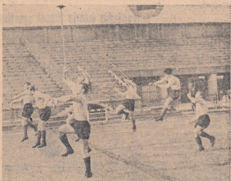
Ieri după-amiază, fotbalistii bulgari s-au antrenat pe stadionul Republicii, iată un aspect de la acest antrenament.