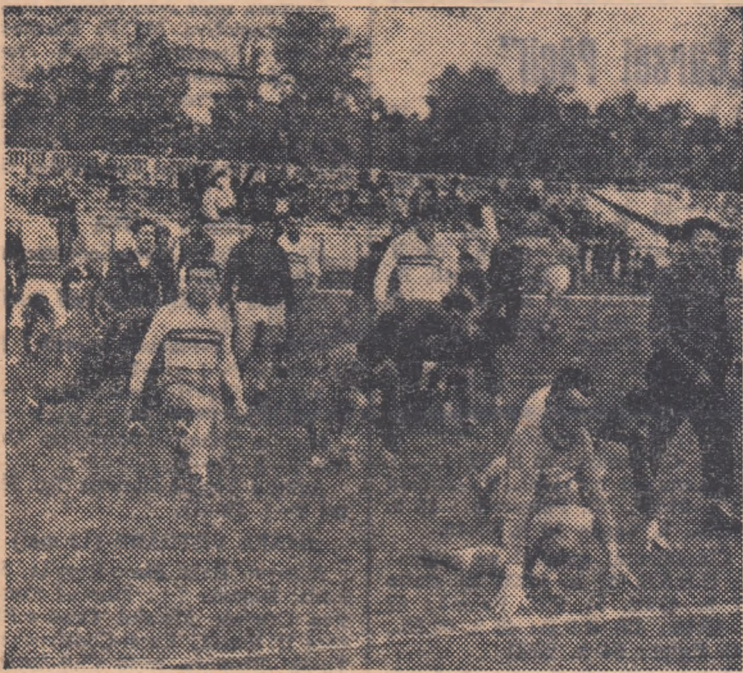
Jocul va începe în curînd. Mai întîi însă încălzirea. (Aspect de la antrenamentul rugbiștilor bucureșteni).