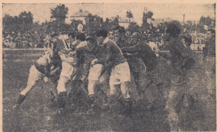
O grămadă deschisă angajată de pachetele de înaintași ale celor două echipe