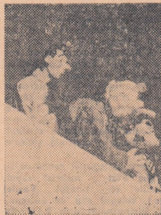
Un gol perfect valabil?!?... Greu de spus! Păreriile spectatorilor sint împărțite... Și, discuțiile se înfiripă repede și nu mai conținesc pînă la sfîrșitul jocului...