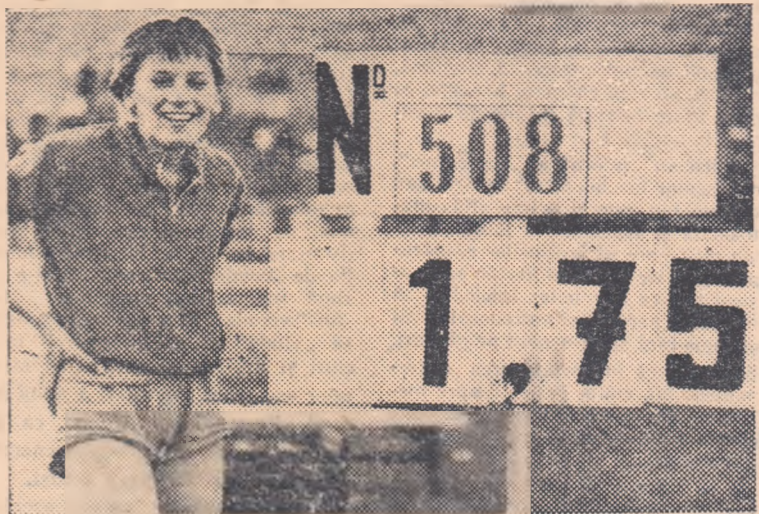
O fotografie istorică: tabela de marcaj care indică noul record mondial stabilit de Iolanda Balaș, care are toate motivele să fie zîmbitoare...