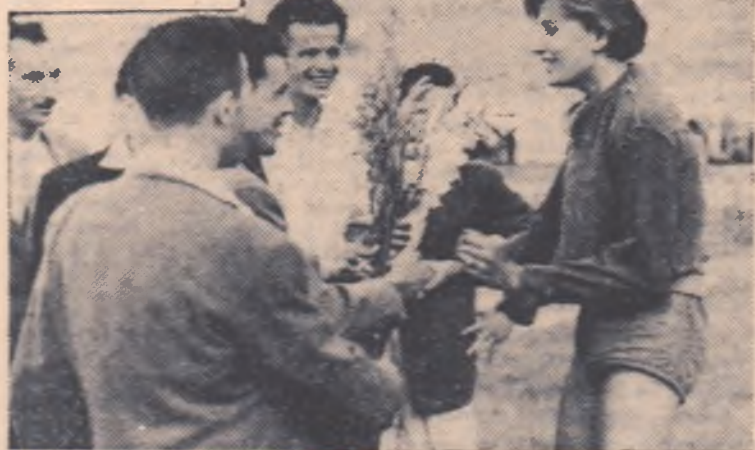
Primul buchet de flori pentru primul record mondial stabilit de o atletă romîncă, este dăruit de un prieten bulgar din echipa de juniori a oaspeților.