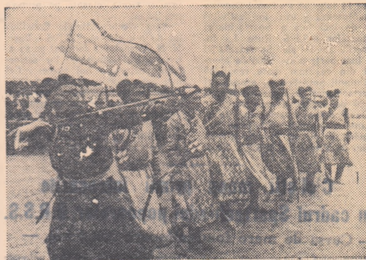
Tragerea cu arcul se bucură de multă popularitate în R. P. Mongolă fiind cu adevărat un sport național.

— Vorbim-ne despre impresiile oastele la Ulan Bator. „Concursul de șah mi-a lăsat totuși timp să fac cunoștință cu orașul, cu oamenii, cu obiceiurile și cultura lor. Am vizitat printre altele excelenta universitate „Cec. Balsan” cu patru facultăți: medicină, științe economice, biologie și științe, numărînd în total peste 1.800 de studenți. O dovadă a creșterii nivelului cultural al poporului îl arată elocvent faptul că în cei 15 ani de existență, universitatea și-a creat cadre proprii de conducere și de predare, uzînd în momentul de față de serviciile a