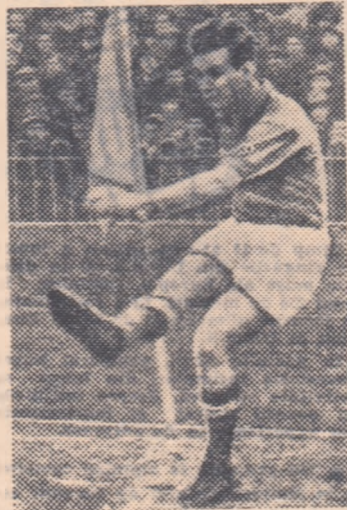
Anatolii Ilîin, unul din cei mai eficași jucători ai echipei Spartak și al Reprezentanței U.R.S.S.