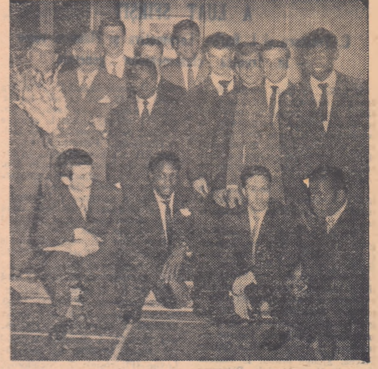
În hotelul aerogării Băneasa, componenții lotului parizian pozează obiectivului fotografic

25 de șuturi dintre care 3 bare. De asemenea, echipa romină a avut inițiativa tot timpul jocului”. Ziarul „MLADA FRONTA”, sub titlul „Infringere la despărțire” scrie: „Echipa noastră a susținut ultimul său meci internațional în această formație, și l-a pierdut. Este ultimul meci, deoarece majoritatea componenților ei vor depăși în curînd limita junioratului și în meciul cu echipa Poloniei vor juca alți jucători mai tineri”. „În ceea ce privește pe oaspeții, aceștia au prezentat o echipă bine sudată și bine pregătită din toate punctele de vedere. În special s-a remarcat linia de atac care este foarte agresivă, componenții ei înțelegîndu-se foarte bine. Toate acțiunile au avut finalitate, terminîndu-se cu șuturi puternice”. Ziarul „RUDE PRAVO”, în numărul său de luni scoate în evidență buna comportare a echipei romine, subliniind că victoria obținută este pe deplin meritată. În sfîrșit, arbitrul întîlnirii, austriacul Jiranek, a declarat: „Am fost surprins de jocul foarte bun prestat de echipa romină. Juniorii romini au jucat cu mult elan, au fost mai rapizi și mai decisi în fața porții, și pe tot timpul meciului au păstrat același tempo susținut. Le doresc noi succese în viitor”.