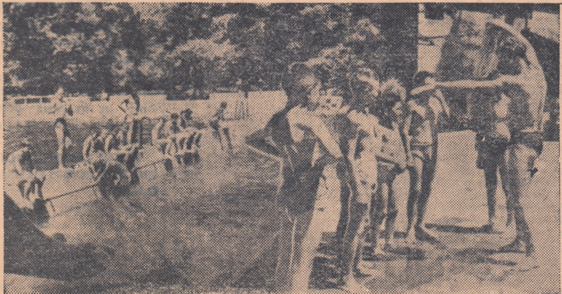
Într-o zi de antrenament la bazinul de inot de la Palatul Pionierilor

Fără îndoială că mulți dintre acești copii vor îndrăgi de acum înainte natația și o vor practica cu multă plăcere. Este de datoria antrenorilor de specialitate din orașele menționate mai sus, să urmărească în timpul întrecerilor pe toți participanții și să treacă la selecționarea acelor care dovedesc calități reale pentru acest sport.