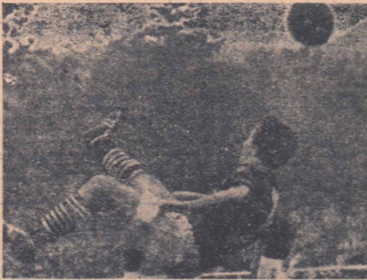
O fază spectaculoasă surprinsă de obiectivul fotoreporterului, în cursul unui joc internațional desfășurat în R.D. Germană. În clișeu stoperul Müller (Jena) execută o frumoasă „foarfecă” pe spate.