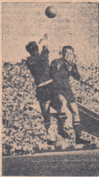
Dintr-un asemenea duel aerian s-a marcat primul gol al lui Dinamo. De data aceasta, însă, portarul echipei GALATASARAY a ieșit învingător.

Fotbaliștii turci știu să se apere organizat și cu promptitudine în momentele critice, dar și să iasă