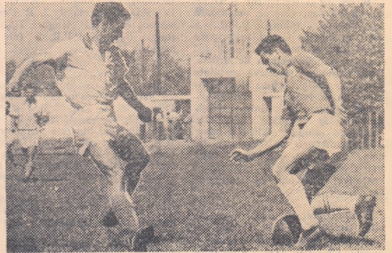
Driblingul atacantului la dezechilibrat pe apărător. Un adversar a fost trecut. Dar nu e ultimul! Fază din jocul Dinamo VI București-Energia Flacăra Cimpina, disputat în prima etapă a returului campionatului categoriei B.

În marea majoritate a echipelor de categoria B întîlnim jucători cu vechi state de serviciu, alături de tineri cu calități și perspective. Ba există situații în care în lotul echipelor aflăm jucători care pot face față cu succes la ora actuală pretențiilor campionatului categoriei A. Energia Metalul Steagul Roșu Orașul Stalin, Recolta Avîntul Tg. Mureș, Energia Metalul Hunedoara, Energia Flacăra Mediaș, E-