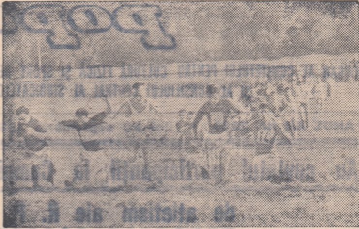
Fiecare întrecere de cros prilejuiește dispute dîrze din care nu lipsesc nici emoțiile, nici surprizele...

Cele 10 zile care ne despart de sfîrșitul primei etape sînt însă suficiente pentru a ajuta colectivele codăse în organizarea întrecerilor de cros să reducă din... handicap. Dar, pentru acest lucru este necesară mai multă seriozitate, mai multă preocupare și, în deosebi, mai multă muncă.