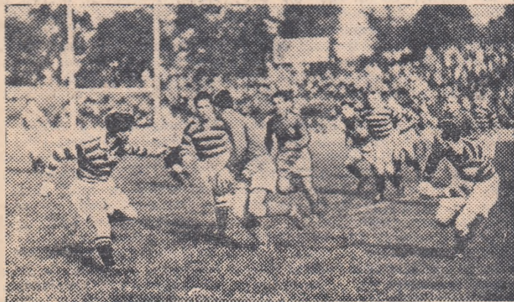
Fază din meciul dintre Leicester Tigers și reprezentativa de rugby, a orașului București. Rezultat: 6-6.