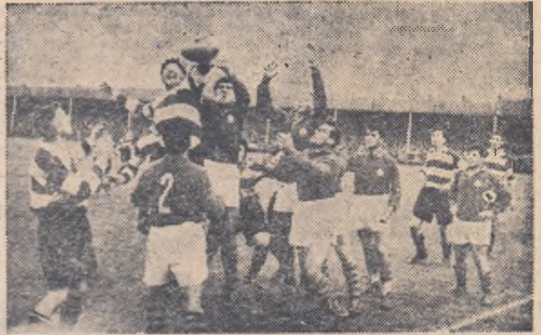
Fază din meciul de la Gloucester

Al doilea turneu în Anglia al echipei Bucureștiului s-a soldat cu un succes remarcabil. După cum se știe, s-au obținut următoarele rezultate: Leicester Tigers — București 6—6 (6—3) Gloucester R.F.C. — București 6—10 (0—0) Bristol R.F.C. — București 8—8 (0—6).