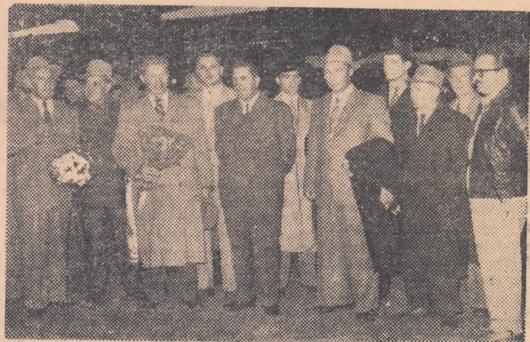
Sportivii sovietici la sosirea în Gara de Nord.

Ieri după amiază numeroși trăgători de frunte, activiști și iubitori ai tirului din țara noastră, au venit în Gara de Nord pentru a-i întîmpina pe primii oaspeți ai campionatelor internaționale de tir, sportivi sovietici. După urările de bun sosit, emoționantele revederi și foto-