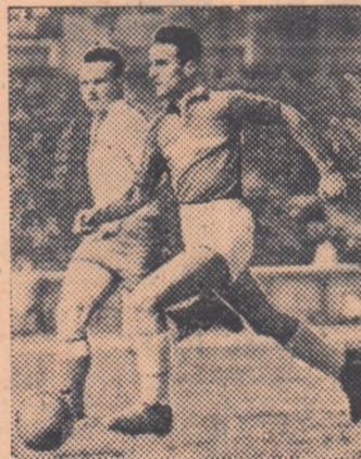
Duminică reprezentativa de surdo-muși din R.P.R. a reușit o frumoasă comportare și un binemeritat succes cu 4—0, în fața reprezentativei poloneze. În fotografie, o fază din acest interesant meci.

● Jocul Energia Tîrgoviște-Locomotiva MCF (cat. C) se va disputa la Moreni, avînd în deschidere meciul de juniori Progresul CPCS-Dinamo Orașul Stalin; partidă Energia Sîlna-Progresul Corabia (cat. C) se va disputa la Buzeni, iar Fl. Roșie Suceava-Progresul CPCS (cat. B) la C. Lung-Moldovenesc.