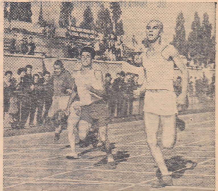
Sosire în una dintre seriile probei de 100 m. plat.