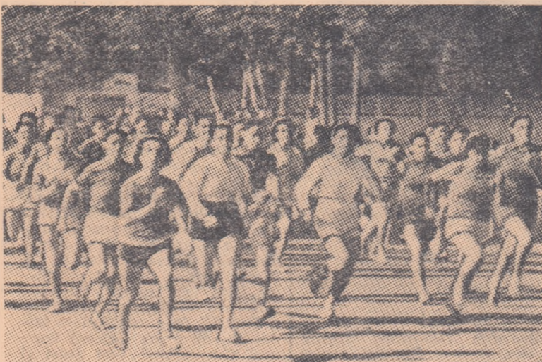
Duminica trecută s-a desfășurat etapa regională a crosului de masă (fotografia noastră reprezintă un aspect de la concursul regiunii București). La 28 octombrie veți putea asista la fața pe orașul București, începînd de la ora 8, pe stadionul „23 August”.