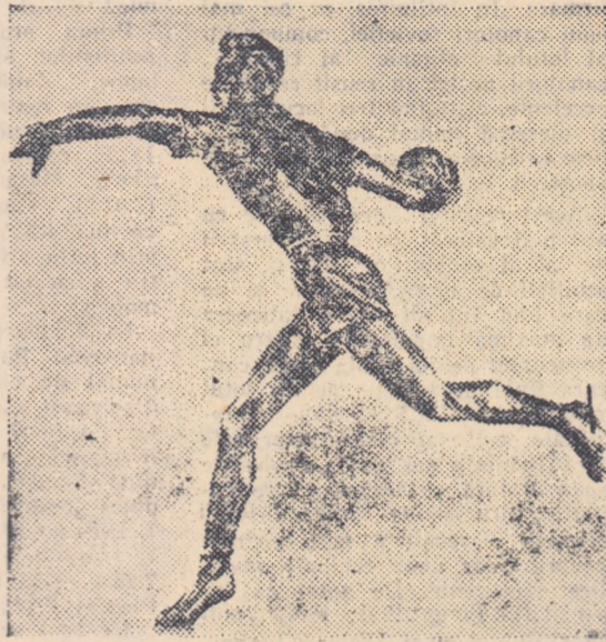
„Jucătorul de handbal” sculptură de Dan Popovici

Există într-o vreme (și n-a trecut prea mult de atunci!) frumoasa tradiție a întrecerilor olimpice de artă și literatură. În 1912, cu prilejul Jocurilor Olimpice de la Stockholm, fusese introdus în programul olimpic acest gen cu totul neobișnuit de întrecere... sportivă. Primele lucrări au fost desigur mai modeste și mai puține la număr. Totuși, cercetînd listele medaliaților (este interesant de arătat că aceștia se bucurau de aceleași onoruri ca și medaliații întrecerilor sportive propriuzise), găsim unele nume cunoscute,