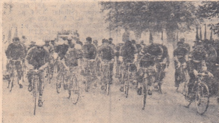
Start în prima etapă a „Cupei 7 Noiembrie”