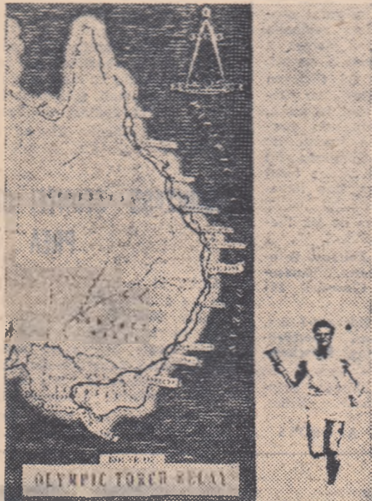
Iată care va fi traseul pe care-l va urma flacăra Olimpică pe teritoriul Australiei: de la Cairns și pînă la Melbourne, de-a lungul Oceanului Pacific.

Sîmbătă a avut loc la Puckapunyal, o localitate la 80 km. nord de Melbourne, un concurs olimpic de atletism în care punctul de atracție era o tentativă de record pe distanța de 1 milă. Tentativa a eșuat, mai ales din cauza timpului nefavorabil, rece, cu vînt și ploaie. Aceasta a influențat și rezultatele de la celelalte probe. În cursa de 1 milă primul a sosit australianul Lincoln în 4:04,8. Al doilea a fost compatriotul său Bailey. Englezii Chotaway și Brasher sau clasat pe locurile 4 și 6, respectiv. La proba de 3 mile primul s-a clasat tot un australian Lawrence cu 13:47,2. La un piept (aceiași timp) a sosit vechea noastră cunosțință Dave Stephens. Alte rezultate — disc: Consolid