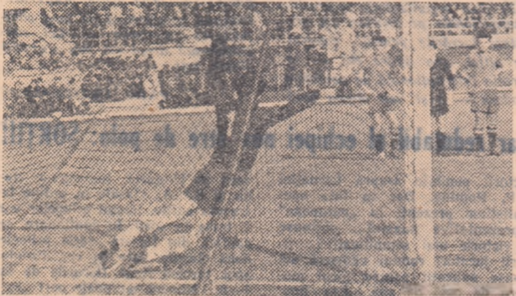
Pionajul lui Ușu a fost înuțit, deoarece Pahonțu a executat defectuos penaltyul trimițînd mingea pe lângă poartă. Fază din meciul Energia Flacăra Ploești — Dinamo București.