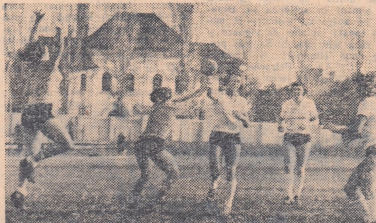
O fază din meciul Fl. roșie Steagul roșu — Energia Reșița, desfășurat ieri în Capitală.

După luni de zile de întrecere — întreruptă o perioadă destul de mare din cauza participării reprezentativei noastre la campionatele mondiale — campionatul feminin de handbal cat. A a luat sfârșit odată cu desfășurarea etapei de ieri. Câștigătoarea titlului republican: Progresul Orașul Stalin, datorită „finișului” său puternic.